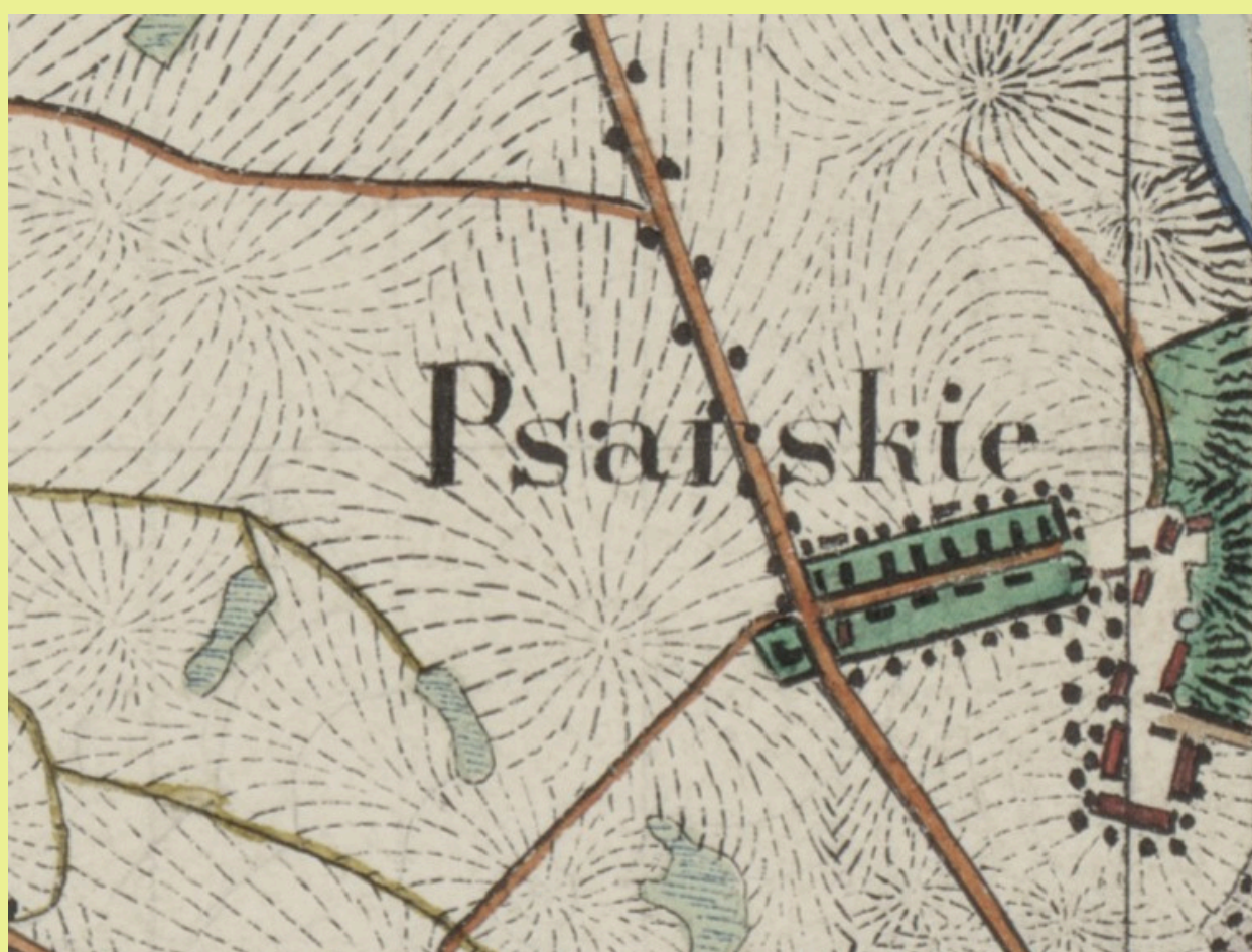
Psarskie w 1826 r. Fragment mapy ze zbiorów Staatsbibliothek zu Berlin, sygn. SBB_III_C_Kart_N 729_Blatt 2132.

Źródła: Z. Szmidt, „Region Śremski” przewodnik turystyczny, Śrem 2011 B. Klimczuk, „Spacer po Śremie”, Śrem 2024 Z. Szmidt, artykuł „Na Szlaku” Psarskie w „Głos Śremski”, 1989 Ludwik_Plater_Broel_pionier_polskie.pdf https://kpbk.umk.pl/Content/201370/Szoldrska_Helena_Halszka_3622_WSK.pdf Mapa - Muzeum Śremskie