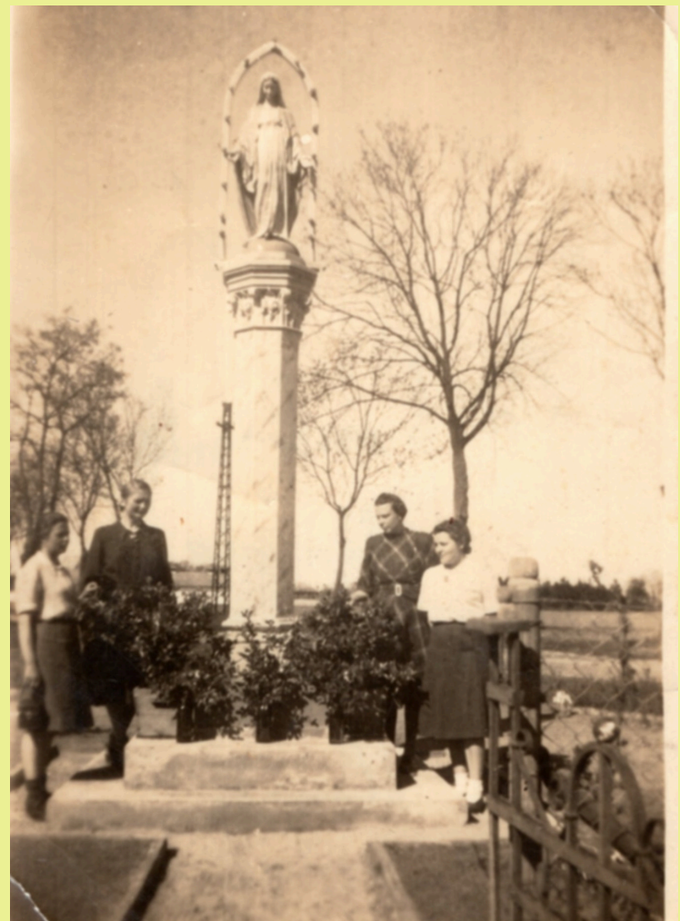
Figura Matki Boskiej Niepokalanie Poczętej w Psarskiem, arch. Halina Dudziak

Do dnia dzisiejszego przy figurze odbywają się nabożeństwa majowe.